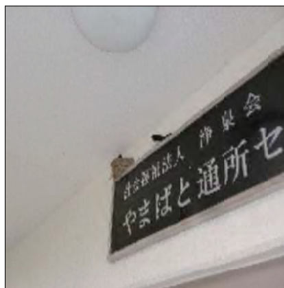
新しい命を守って奮闘中です。

最初はえええうっという感じで したが、利用者様とも相談の上、 皆で掃除もすっかりやって見守っ ていこうということになりました。 この原稿を書いている時点では、 親鳥が卵を温めている所ですので、 会報の発行の頃には新しい命とと もに、つばめたちが新たな旅立ち を迎えている頃だと思えます。利 用者様と共に楽しみにしています。