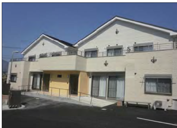
新規開所のやまばとハウスⅠ・Ⅱ

現在利用されている方々ですが、9名の利用者様がやまばと学園施設入所からの移行となっており、2名の方が法人内別グループホームから移動となっている状況です。また、現在利用されている方の多くが環境変化等を苦手とされる中、4月20日からの入居開始を前に利用者様、職員共に不安と緊張、そして期待が入り混じる中での引越となりました。実際に20日以降順次数名の利用者様が日を分けて入居していただきましたが、今までの生活介護事業での多くの経験があったためか、支援者側が想像していた以上に皆様新たな環境の生活を受け入れてくださっております。中にはやはり不安のためか不眠の方などがいらつしやいましたが、おおむね穏やかにゆつたりとグループホームでの地域生活を